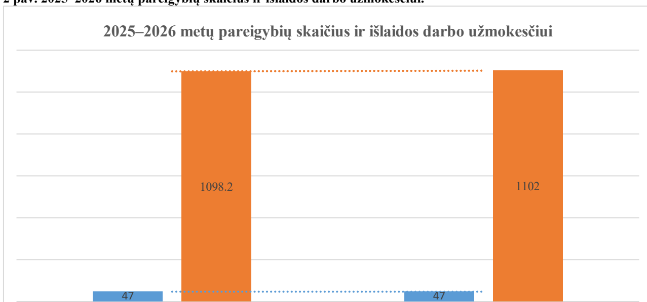
2 pav. 2025–2026 metų pareigybių skaičius ir išlaidos darbo užmokesčiui.

Lietuvos metrologijos inspekcijos administracijos padalinių, jų pareigybių naikinimo ir steigimo bei valstybės tarnautojų ir darbuotojų, dirbančių pagal darbo sutartis pareigybių sąrašas, patvirtintas Lietuvos metrologijos inspekcijos viršininko 2022 m. gegužės 5 d. įsakymu Nr. 11V-92(1.2) „Dėl Lietuvos metrologijos inspekcijos administracijos padalinių, jų pareigybių naikinimo ir steigimo bei valstybės tarnautojų ir darbuotojų, dirbančių pagal darbo sutartis, pareigybių sąrašo patvirtinimo“. Inspekcijoje nustatytas pareigybių skaičius – 47 etatai.